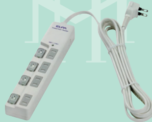
スイッチ付きタップ