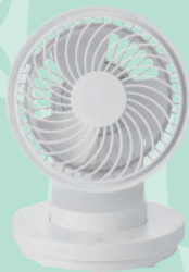
マルチデスクファン (W15×D15×H21)