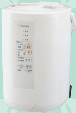
スチーム式加湿器

ポットみたいに、お手入れ簡単! 清潔な蒸気のスチーム式 沸騰させたきれいな蒸気を、 約65℃まで冷ましてお部屋を加湿します。