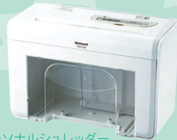
パーソナルシュレッダー

ポットみたいに、お手入れ簡単! 清潔な蒸気のスチーム式 沸騰させたきれいな蒸気を、 約65℃まで冷ましてお部屋を加湿します。