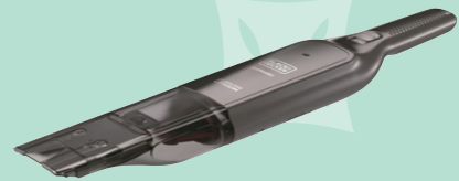
ハンディクリーナー