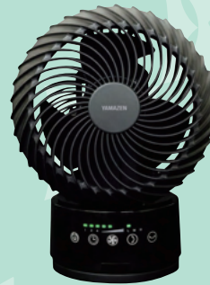
サーキュレーター